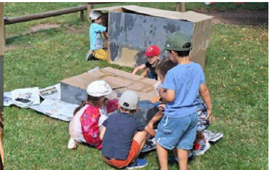
Activité manuelle pour les moins de 6 ans.