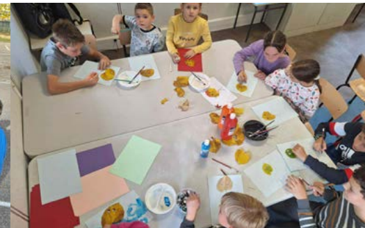
Activité manuelle sur une «drôle de feuille»