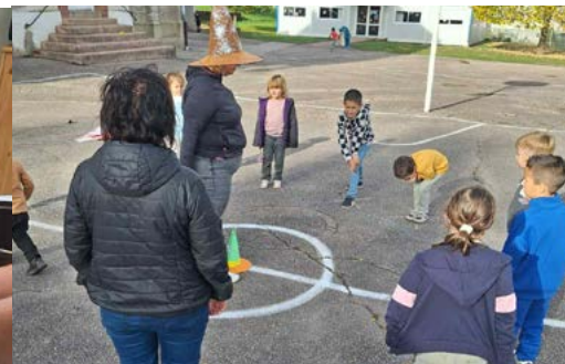
Sur le thème d'Halloween, jeu de la sorcière en extérieur.