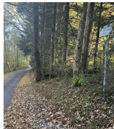
Rue des 2 frères Bietrix