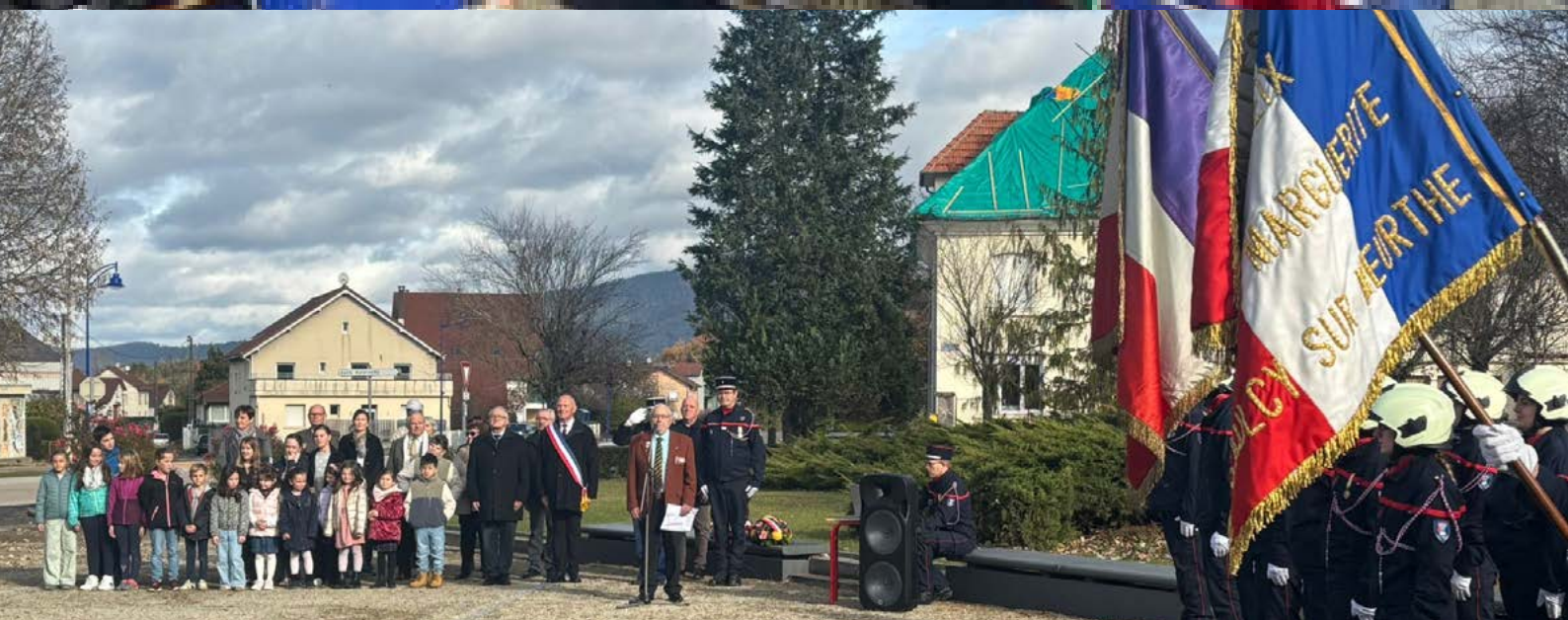
Commémoration du 11 novembre 2025