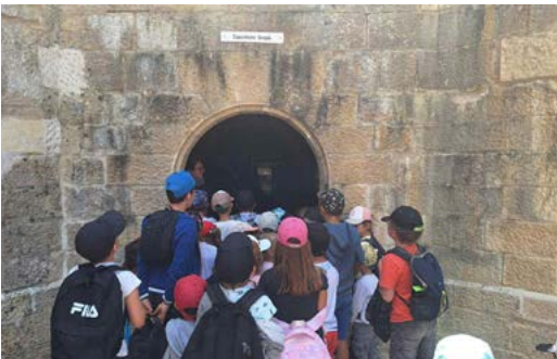
Sortie au fort aux énigmes à Montigny - les - Neufchateau.