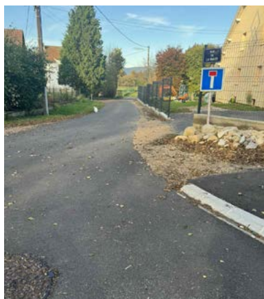
Rue la Maize

Montant total des travaux 83 435,04€ T.T.C.€ (dont Subvention du Département de 11 532,00 €) :