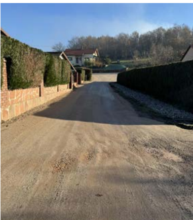
Chemin du terrain de manœuvre

Montant total des travaux 78 344,44€ T.T.C. (dont Subvention du Département de 11 837,00€) :