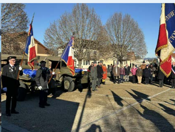
Libération de Saulcy