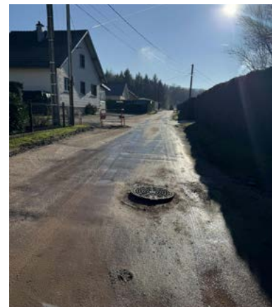
Route de Mardichamps