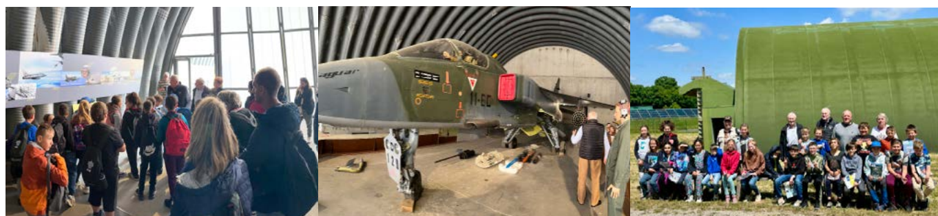
Juin 2025 : Journée à la base aérienne de Toul Rosières en lien avec René FONCK et la 1ère guerre mondiale pour la classe de CM2 ( organisée avec l'association René FONCK)