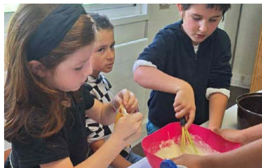
Atelier cuisine avec des crêpes d'Halloween