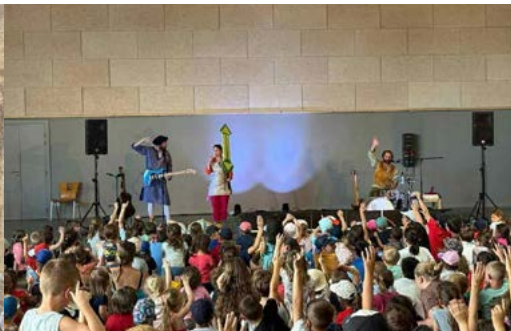
Après-midi spectacle avec les différents site Lor'Anim.