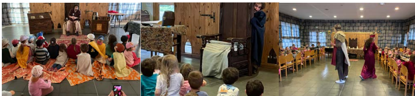
Mars 2025 : Spectacle sur le thème d'une machine à remonter le temps pour les enfants de l'école maternelle.